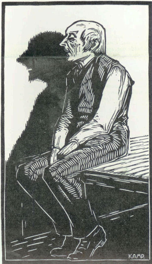
Naar een houtsnede van B. Kamp

De jonge baron was „niet goed van oppas” geweest, had schulden gemaakt, en de „boel verhypothekerd.” Eindelijk zijn laatste geld in Frankrijk verspeeld. Het landgoed was onder den hamer gekomen, maar er waren geen liefhebbers geweest voor zoo'n duur en groot stuk grond.