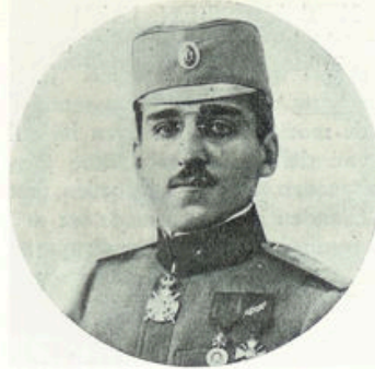
Koning Alexander van Joego-Slavië †

HET WAS BEGIN JULI 1914, dat we onder dezen titel een korten indruk gaven over het zoo wreed verstoorde geluk in het gezin van aarts Hertog Frans Ferdinand van Oostenrijk. Hij en zijn gemalin werden op denzelfden dag door revolvergeschoten gedood. — Verstoord was het geluk van dit koninklijke gezin.