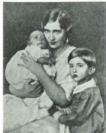
Koningin Maria met twee harer kinderen. Een foto van enkele jaren geleden.