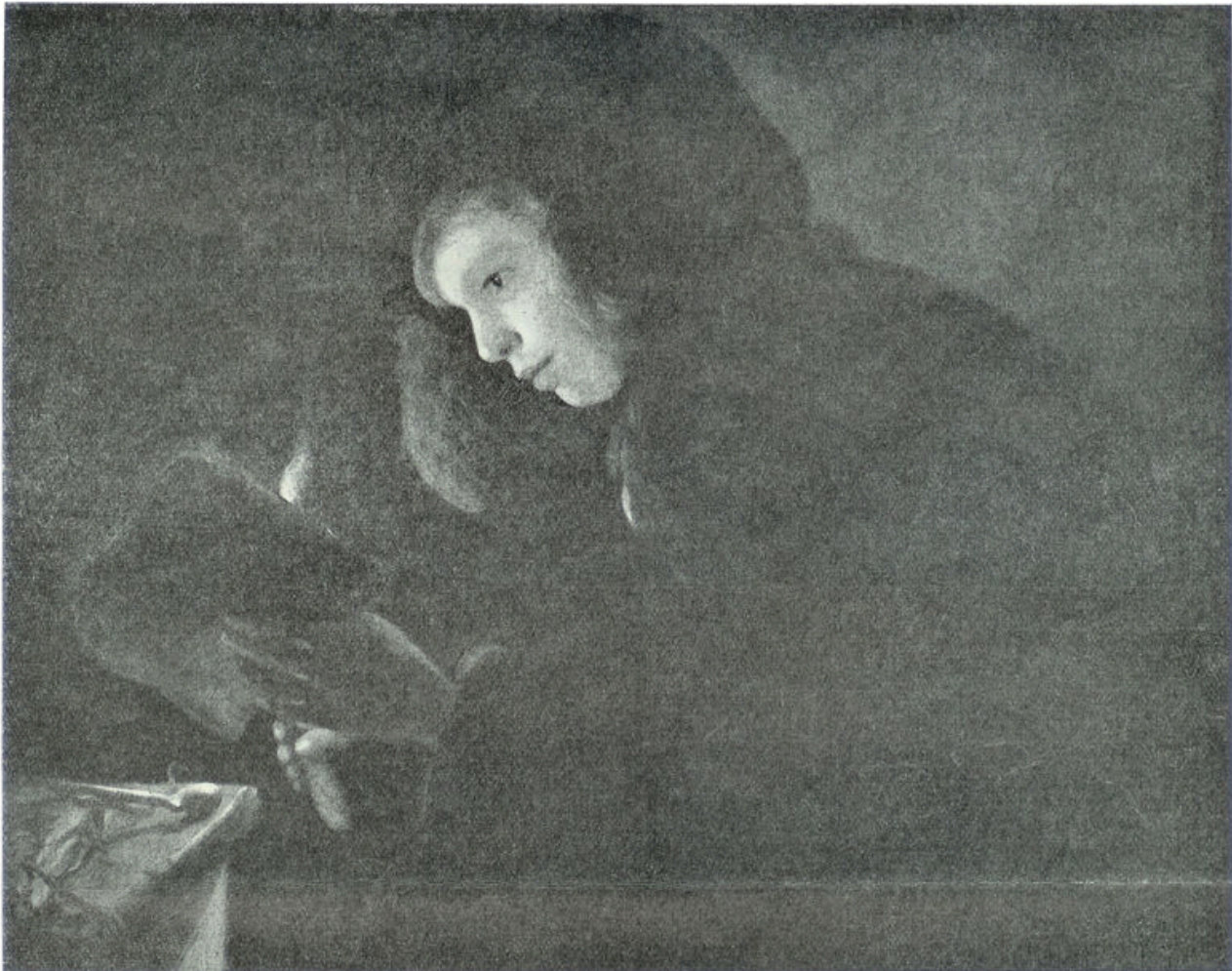
Naar een schilderij van Chr. Dusart (1645)