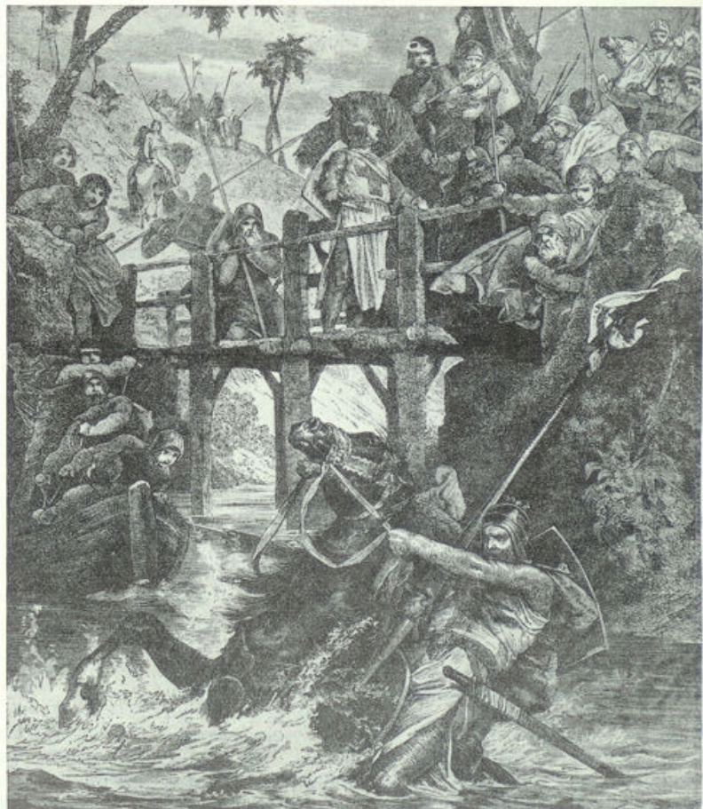
Barbarossa dwingt zijn paard de rivier in te gaan.