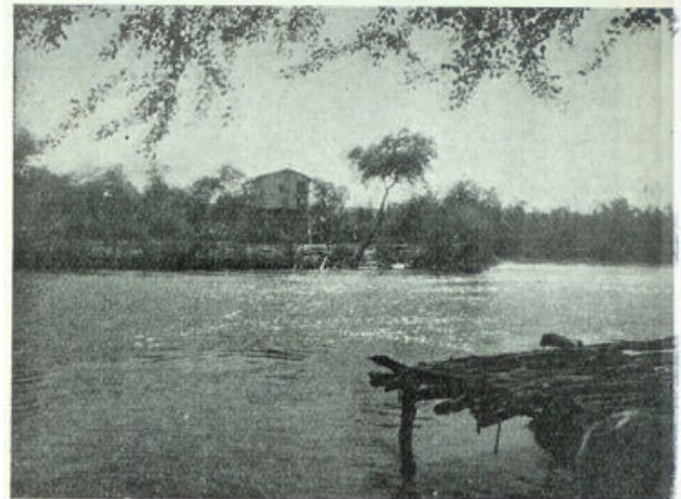
De plaats, waar Jezus gedoopt is.