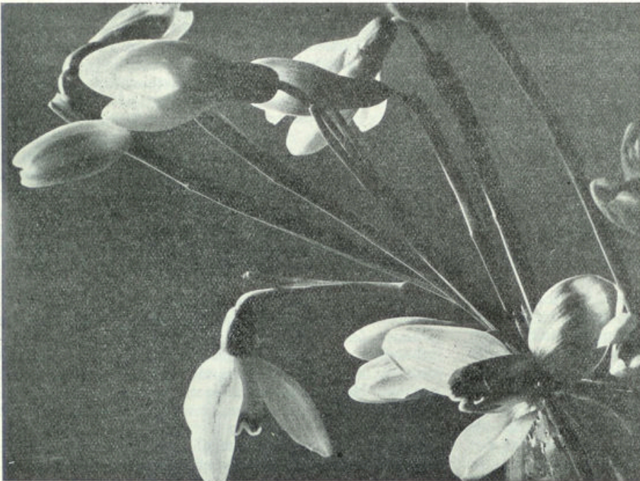
Sneeuwkllokjes. Onze Februari-bloeiërs.