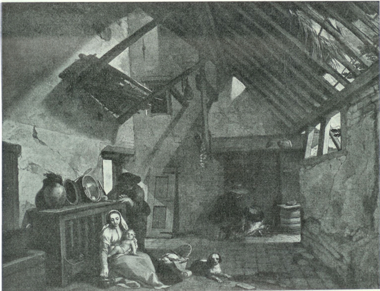
Naar een schilderij van P. Bloemaert (1632) in het Rijksmuseum, Amsterdam

Daar is genade, die den mensch leert zeggen: „Ik vermag alle dingen door Christus, die mij kracht geeft.”