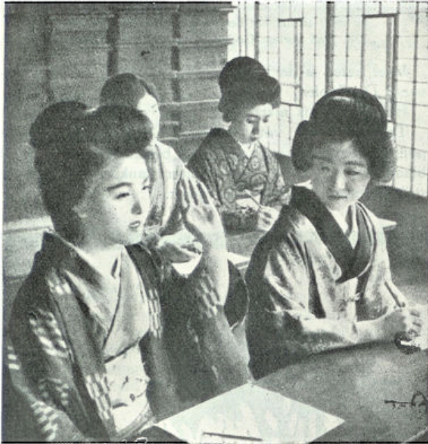
Een Japansche school. „Ik ben klaar met mijn werk.”