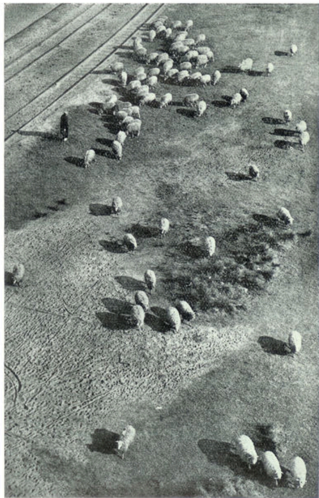
Naar een kunstfoto