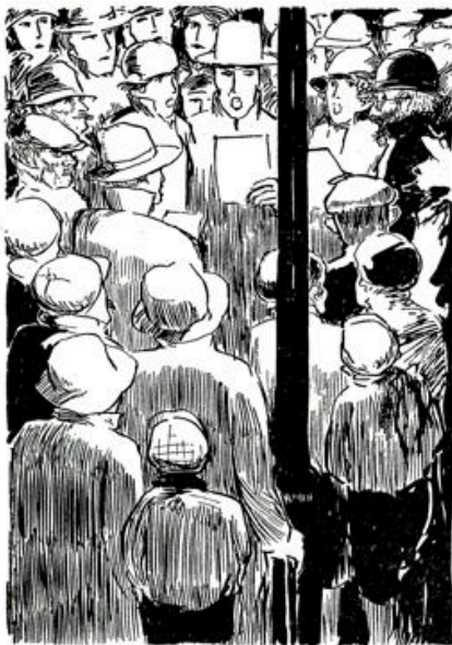
.... Dan zetten ze in ....

Gewerkt heeft hij, in grensplaatsen eerst. Mooier dan thuis zou hij het leven gaan vinden.