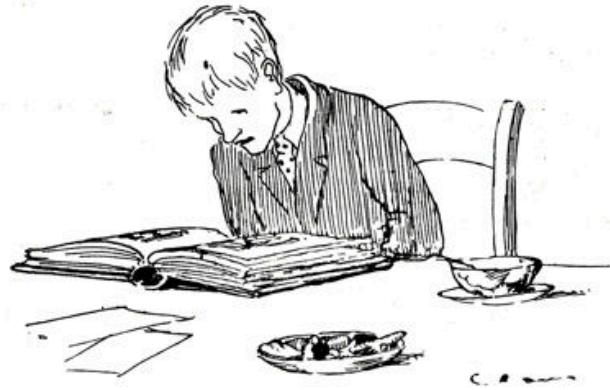
Aandachtig tuurde hij op een plaat.

niet uitgepraat. „De mannen op 't fabriek zeggen 't ook, juf. Reindert zegt: 't is oudewijvenpraat.”