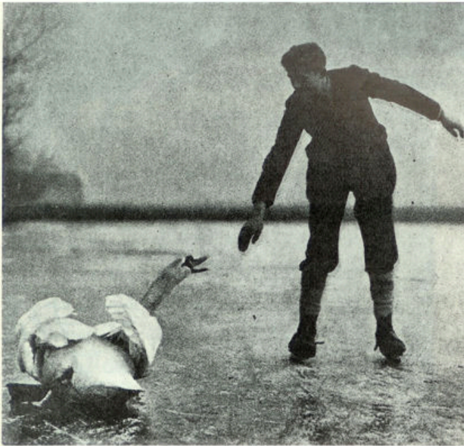
In en uit zijn element