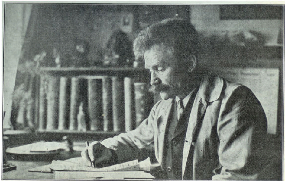
☒ „op zijn stoeren kop, zoo klaar en krachtig gekorven, staat, steil overeind, 't streuvelhaar, waaraan hij zijn bijnaam dankt.” ☒

Stijn Streuvels is een der grootste zonen van Vlaanderen. In de geschiedenis der Groot-Nederlandsche literatuur is zijn naam blijvend gevestigd. Geve God, dat de nu zestigjarige nog vele jaren moge voortwerken aan zijn schoonen levensarbeid, waaraan hij heel zijn rijke persoonlijkheid gewijd heeft. Q. A. DE R.