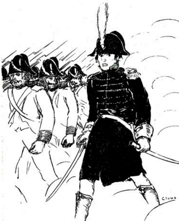
„Groote, zware kerels waren er bij, met ruwe baarden . . . .” ☒

Die Franschen verstonden het tòch niet, dachten ze. Maar zoo nu en dan kwam er ineens een snauw van