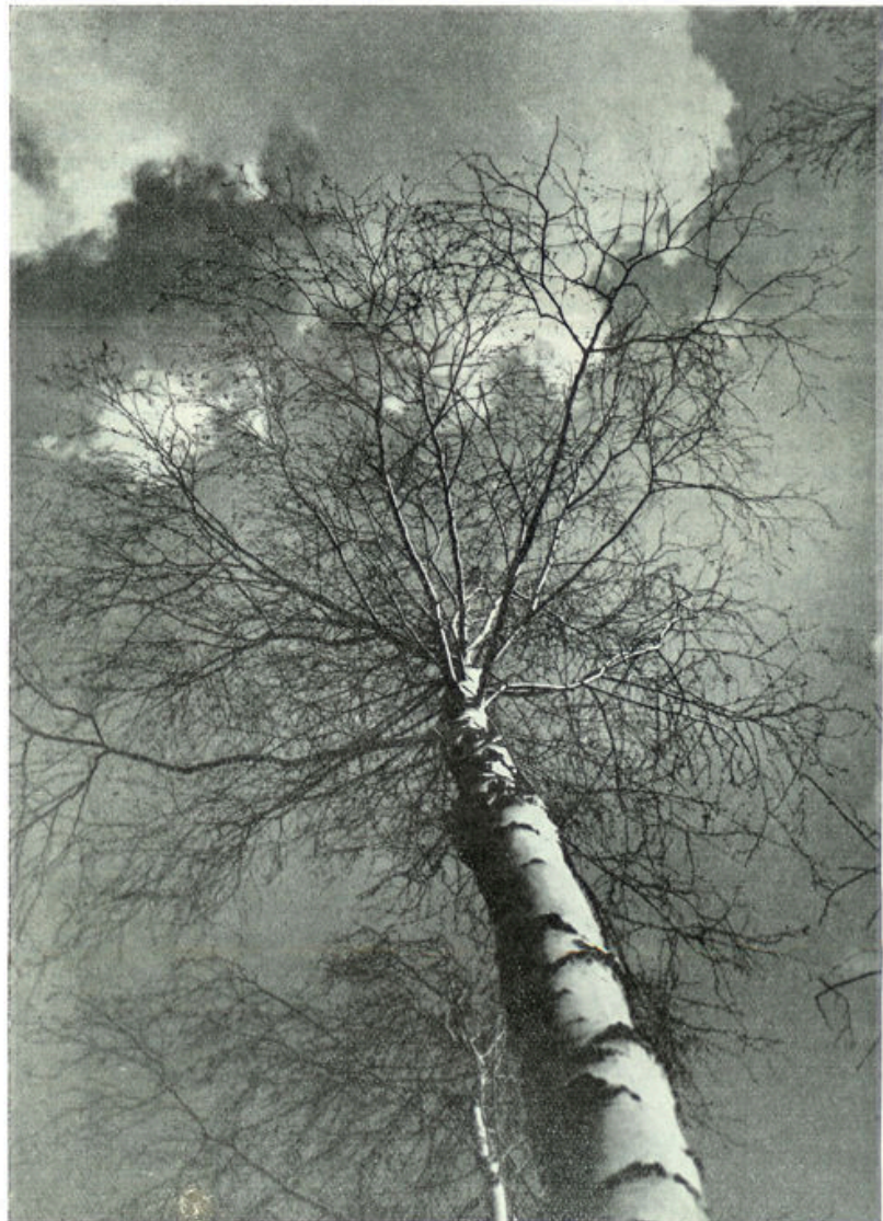
Naar een kunstfoto