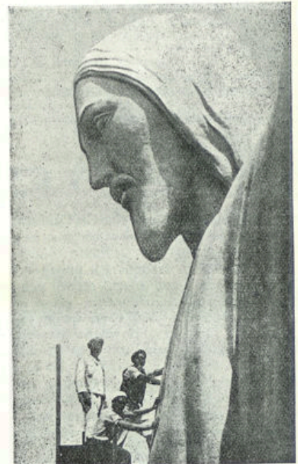
De laatste hand wordt gelegd aan het reusachtige beeld.

Met de armen uitgebreid staat daar de Christus en roept: „Ik ben het licht der wereld.” Maar de Vesuvius en het oude Petersburg toonen het zoo duidelijk aan, dat men helaas het valsche licht verkiest. En hoe zal men dan veilig worden geleid naar den waren Dageraad?