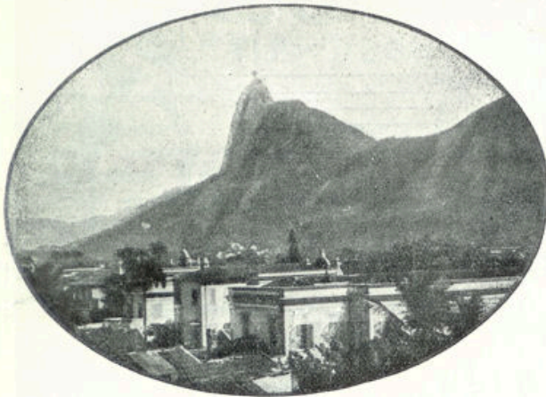
De berg Corcovado, op welks top het Christusbeeld duidelijk zichtbaar is.