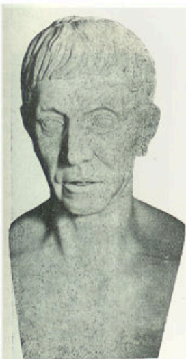
Buste van Haydn