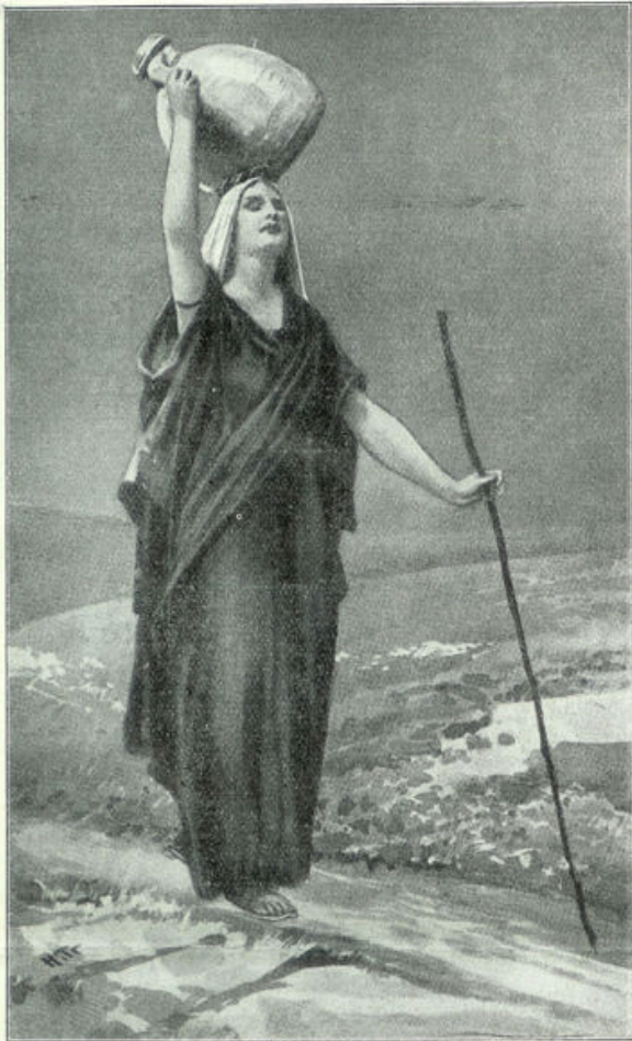
☒ Een blinde in Palestina

Onze sympathie moge ook dit levende monument van de Christelijke barmhartigheid in het Heilige Land omvatten.