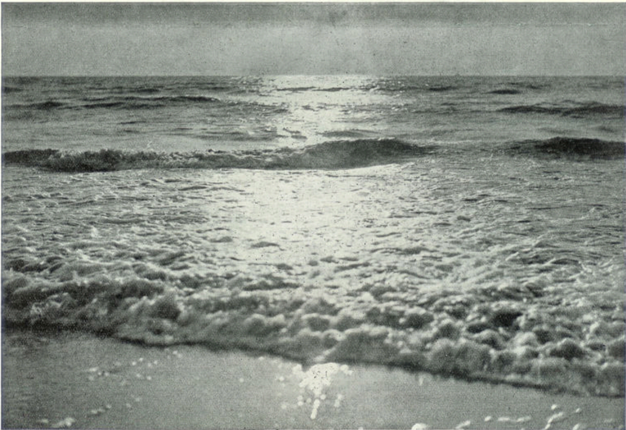
Naar een kunstfoto

De nooit rustende, waarbij en waarop in de zomermaanden zoovelen rust en verkwikking zoeken.