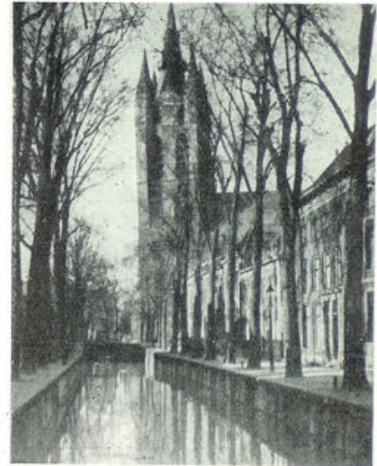
Gezicht op de Oude Kerk