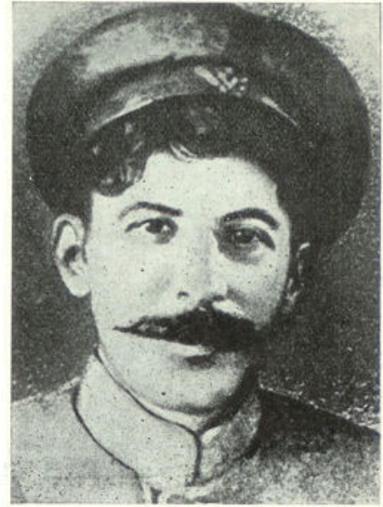
Stalin als jongeman.

Toen Stalin — want we zullen hem nu maar gaan noemen bij zijn regeerdersnaam: man van staal — toen Stalin van het seminarium was weggejaagd, sloot hij zich aan bij de socialisten. Hij