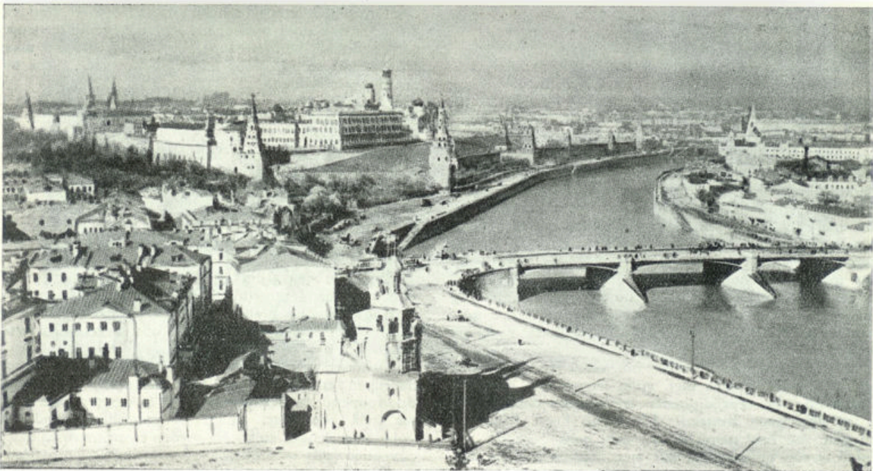
Een blik op Moskou. — Het groote gebouw links van de rivier is het Kremlin.

Zal het nog lang zoo zijn? Zal Stalin nog lang regeeren in naam van het proletariaat, maar in werkelijkheid in eigen naam? We weten het niet en niemand weet het, dan God alleen. Maar Hij heeft dan ook meermalen in de wereldgeschiedenis andere mannen van staal ten val doen komen. Nebukadnezar werd, toen zijn hoovaardij te groot werd in Gods oog, den dieren des velds gelijk, waarmede hij gras at. En van Lenin weten we, dat ook deze trotsche mensch,