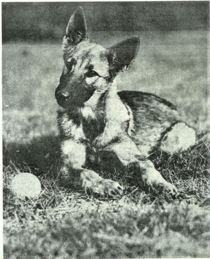
Naar een kunstfoto