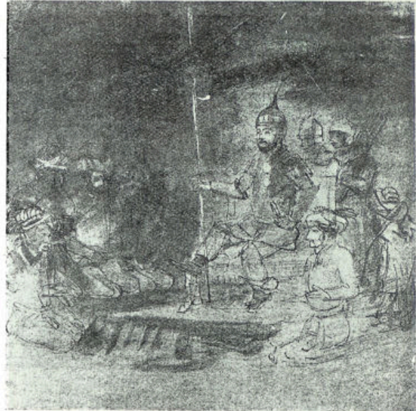
Naar een teekening van Rembrandt in het Louvre te Parijs

Magiër, beheerscher der uiterlijke wereld, die niet met woorden en gebaren, maar met de wereld , die hij verbeeldt, spreekt, en die ook zelf niet spreekt, maar het al door zich laat spreken zóó, dat ge den Schepper en Onderhouder werkzaam voelt achter het gesproken