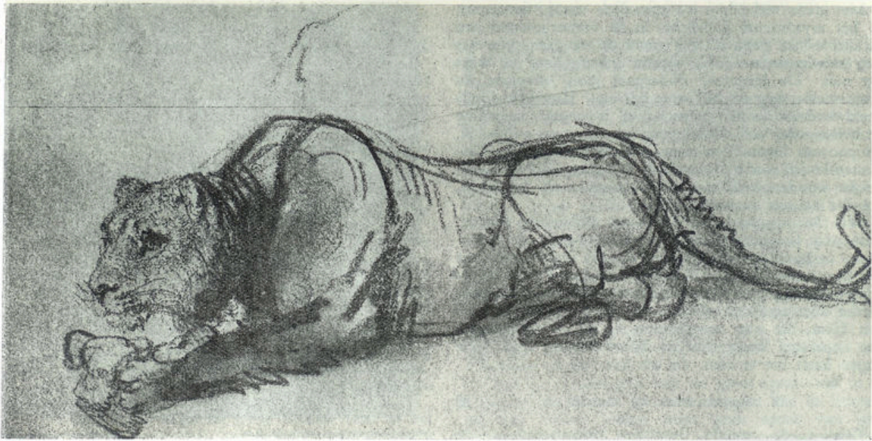
Naar een teekening van Rembrandt in het Britsch museum te Londen