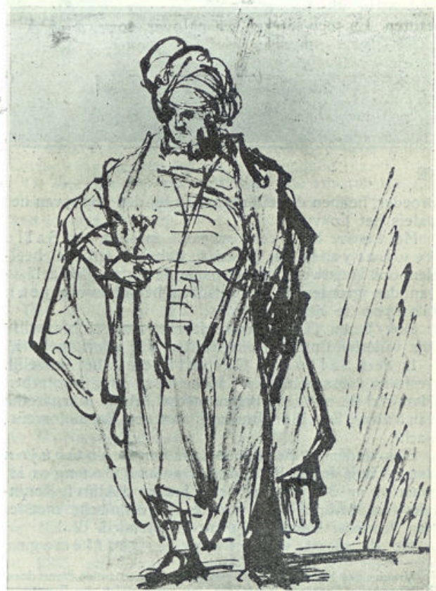
Naar een tekening van Rembrandt in het Louvre te Parijs

Een Turk kan hij, intusschen, of althans diens dracht, als een van ver aangevoerde merkwaardigheid ergens gezien hebben. Misschien sloe n vele andere vreemdelingen, een Turksch, of gekleed, koop-