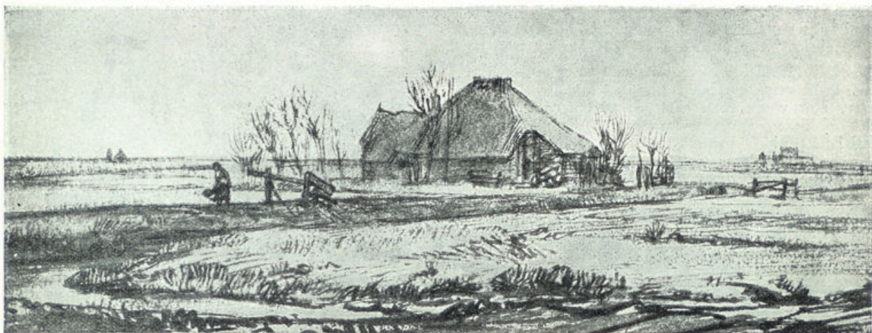
Naar een ets van Rembrandt