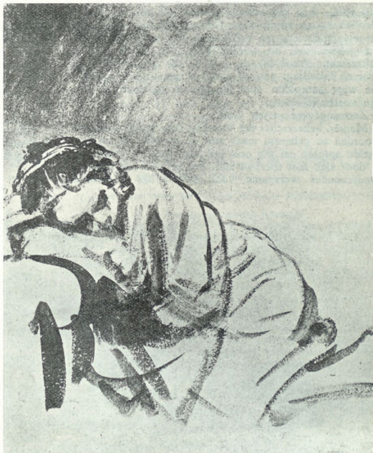
Naar een teekening van Rembrandt in het Britsch museum te Londen

Is het het slapende meisje, of de slaapzelve, die ons hier het meest ontroert?