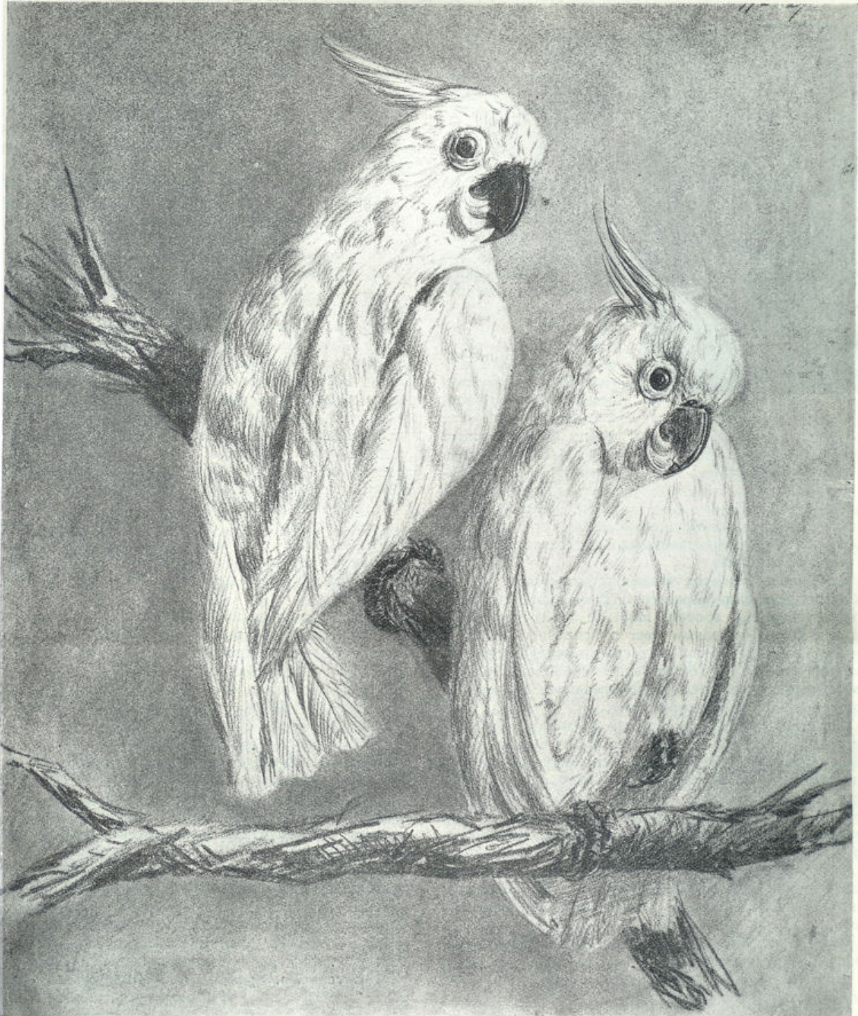
Naar een krijttekening van B. Bytelaar