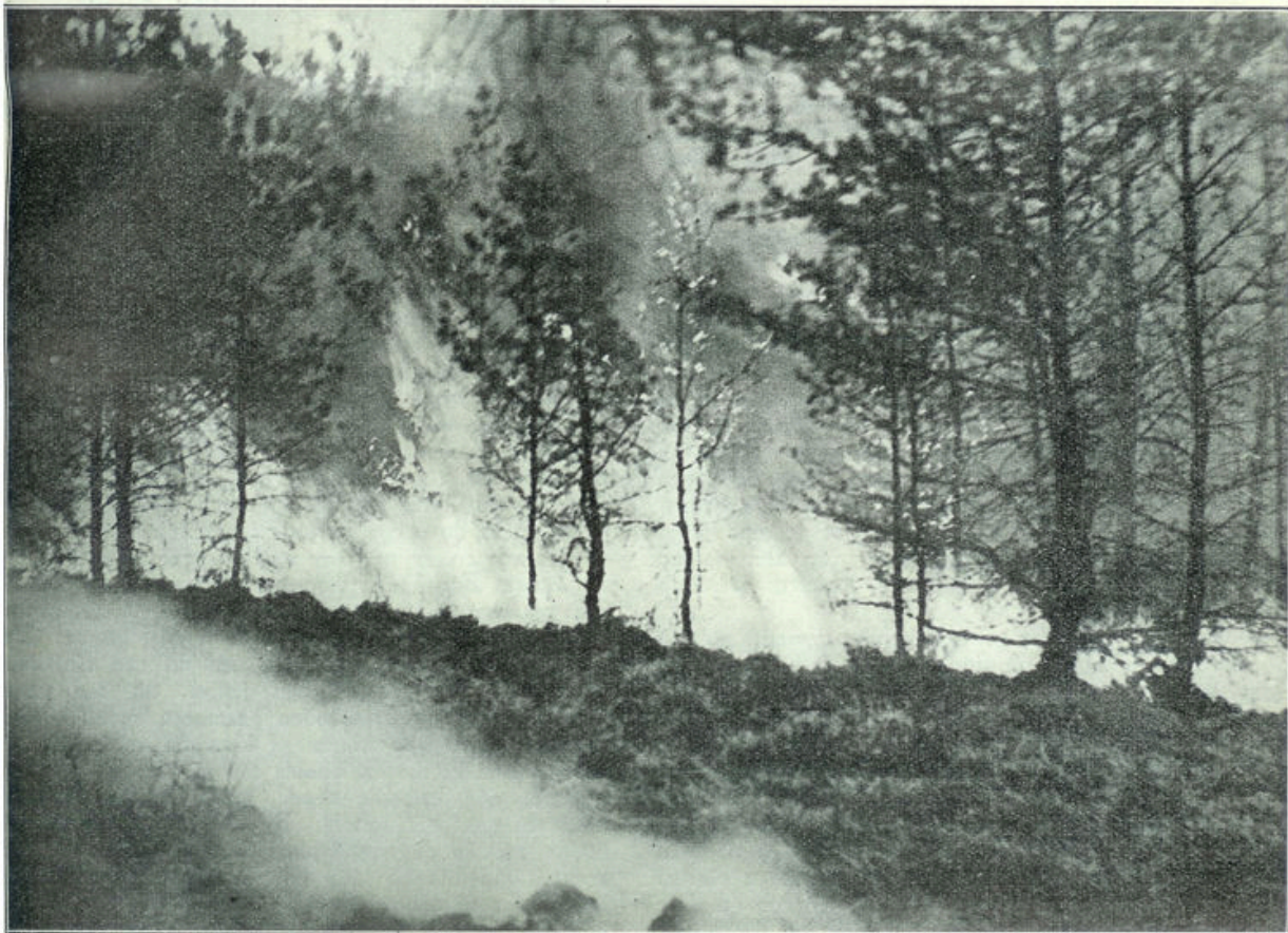
Boschbrand. — Een blik op de vlammenzee, waardoor bosschen in het Oosten van ons land geteisterd werden.

A LS GE NU WETEN WILT, HOEVEEL WE zijn vooruitgegaan op het gebied van de Christelijke jeugdlectuur, dan moet ge eerst op uw gemak eens Gerdes' boeken lezen — neem de beste maar — en dan moet ge u eenigen tijd met Van de Hulst bezig houden. Dan valt u het onderscheid dadelijk op. Bij Gerdes interessante, spannende verhalen. Maar een zonderlinge, stijve taal. Boekentaal, wonderlijk aandoende in een tijd na '80. Bij Van de Hulst goede, behoorlijke zinnen, kalme verteltrant, levendigheid in den dialoog, meer kinderlijkheid. Meer van dezen tijd. Hij vertelt, Gerdes beschrijft. Gerdes geeft ook in zijn beste boeken, waaronder ik nog steeds de Wouter Harmsen-serie reken, geen menschen van vleesch en bloed, maar wandelende ideeën van goed en kwaad, van godsvrucht en boosheid. En Van de Hulst teekent jongens en meisjes, van wie ge, ook al doen ze als Gerdientje nooit kwaad, toch niet de gedachte voelt opkomen, dat het geen echte kinderen zijn. Gerdes is vóór alles evangelist en zijn personen zijn niet anders dan aankleedingen van zijn evangelisatie. Van de Hulst is vader, is schoolmeester en ge ziet telkens en telkens weer, hoe hij met een kinderlijk, open, liefhebbend oog zijn kinderen ziet, ook in hun fouten en in hun gebreken, in hun moeite en strijd,