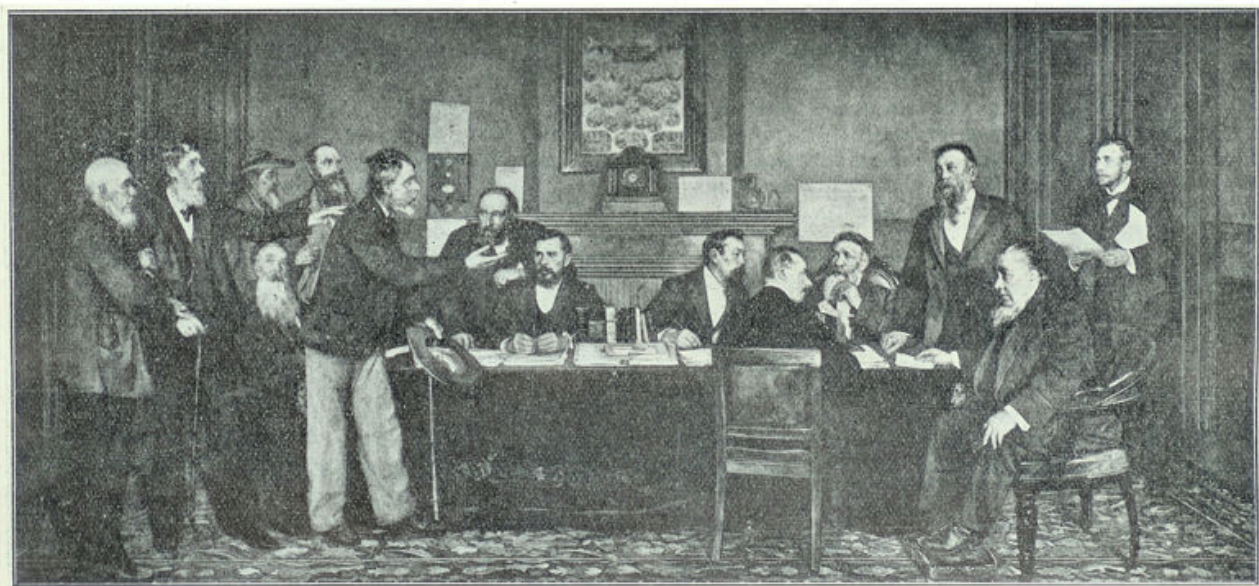
Paul Krüger ontvangt een deputatie van zijn volk