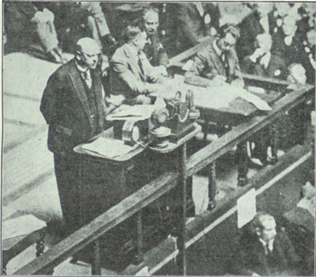
Stresemann houdt zijn rede in den Volkenbond

keren. In een zondige wereld is een eeuwige vrede onmogelijk.