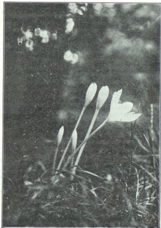
genomen 4 Sept. 1926.

HERFSTTIJLOOS. Bloeit van September tot November — Uit een crocus komt meestal één bloem: uit een herfsttijloos twee of meer