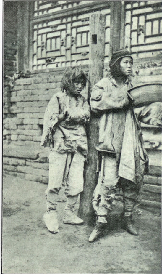
⊠ BEDELENDE MEISJES IN PEKING ⊠

Ons zuiver Hollandsch spreekwoord zegt: Na goeden arbeid, rust het echt. H. W. A.