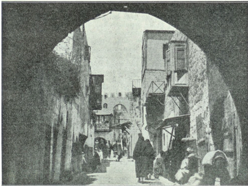
De straat, die naar de Damaskuspoort leidt

Thans echter had hij zijn hartewensch gekregen; nu geen werkeloos toeschouwer meer, maar ijveraar voor de Oud-vaderlijke wet.