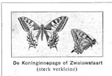
De Koninginnepage of Zwaluwstaart (sterk verkleind)

O NZE GROOTE ENTOMOLOOG, DR. Oudemans, beweert, dat er in ons land 79 soorten van dagvlinders zijn. En onder deze is de Koninginnepage of Zwaluwstaart (Papilio podalirius) de grootste. Hij bezit een vlucht van 62 tot 88 mM. Z'n kleur is in hoofdzaak geel met zwart; wat op de tekening wit is, is in werkelijkheid geel. De donkere rand van de achtervleugels is blauwachtig, terwijl onder aan den binnenrand van elk der achtervleugels een donkere vlek zich bevindt, die in werkelijkheid oranjebruin is.