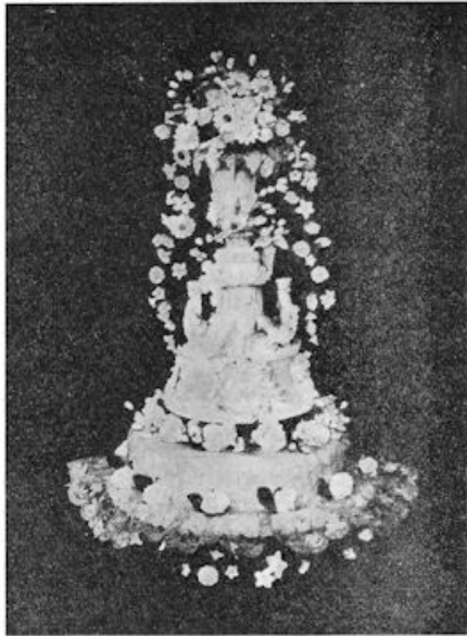
Gebak voor de Koninklijke Bruid

Tusschen den dag der aantekening (21 Jan. 1901) en dien van het huwelijk kwam de Hertogelijke bruidegom in de Residentie aan. Op den huwelijksdatum was Koningin Wilhelmina twintig jaar, vijf maanden en zeven dagen oud, en het is wel een bijster treffende