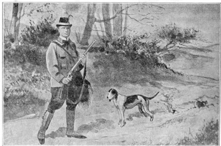
De Prins als jager