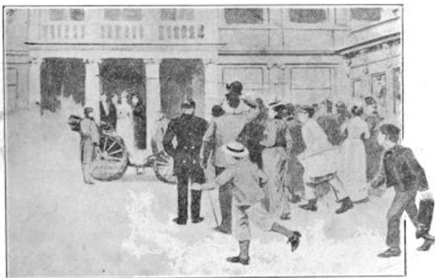
„De Koningin rijdt uit!"

Het ligt niet in de bedoeling van dit artikel om den lezer nog weer eens al den hofluister en de volksvreugde te beschrijven, die rond den 7 en Februari 1901 oog en hart hebben geboeid. Nadat de Koningin-Moeder met haar dochter 15 October 1900 op Het Loo was teruggekeerd uit Duitschland, werd op den 17 en in een proclamatie „Aan Mijn Volk" de verloving bekend gemaakt. „Ik zal slechts den man huwen, dien ik liefheb," zijn de woorden der Koningin, waarmee