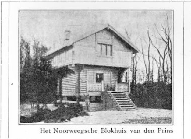
Het Noorweegsche Blokhuis van den Prins

Het jaar 1900 was voorts niet het eerste, waarin Oranje en Mecklenburg elkander „vonden.” Een der zestien kwartieren in het wapenveld van Stadhouder Koning Willem III was het Mecklenburgsche, en op 27 Mei 1708 zag men te Leeuwarden het huwelijk voltrekken tusschen Prinses Sophia van Nassau-Dietz en Hertog Karel Leopold, een Mecklenburger. Op 23 October 1799 werd opnieuw een band gelegd tusschen de twee Huizen; toen huwde Hertog Frederik Lodewijk, zoon van Frederik Frans I van Mecklenburg met de Grootvorstin Helena Paulowna van Rusland, de overgrootmoeder van Prins Hendrik van Oranje. De derde verbintenis was die van 7 Februari 1901, te 's-Gravenhage. ☞