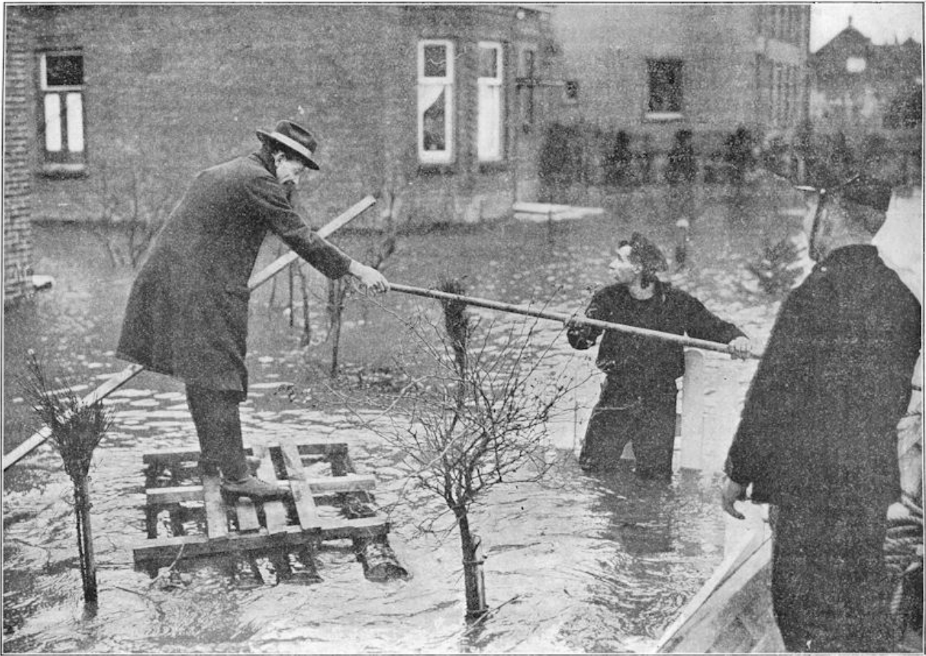
Een vluchteling, wiens vlot door den stroom dreigt meegesleurd te worden, krijgt hulp van onze wakkere mariniers.