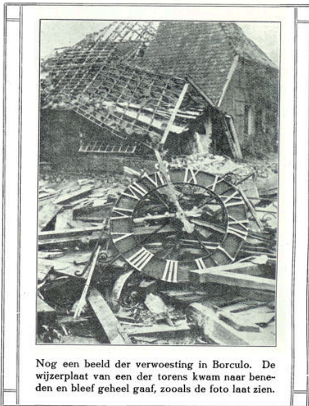
Nog een beeld der verwoesting in Borculo. De wijzerplaat van een der torens kwam naar beneden en bleef geheel gaaf, zooals de foto laat zien.