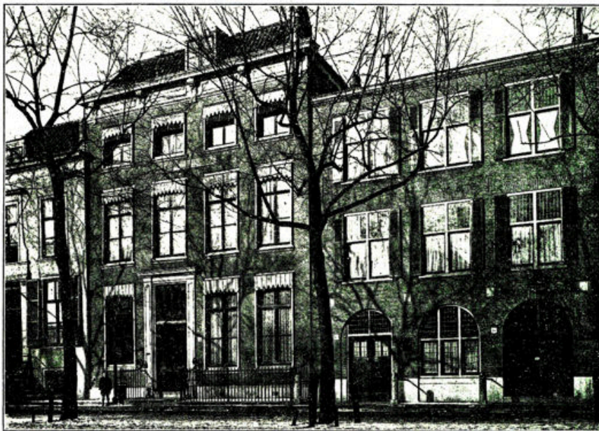
DUNNE BIERKADE 17 en 16.