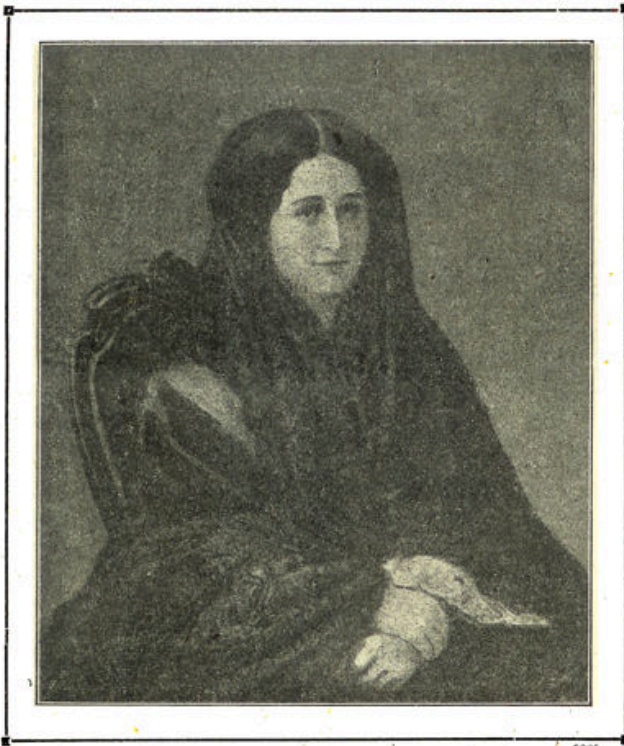
Ex-Keizerin Eugénie. †