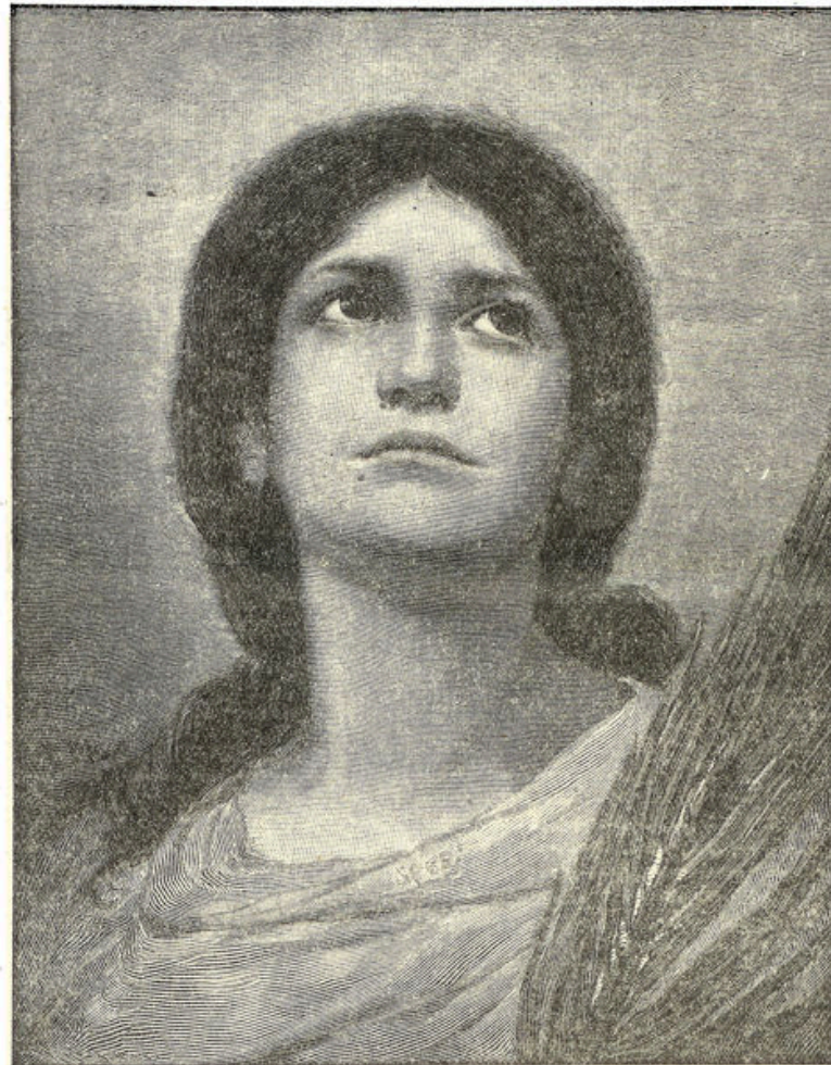
Naar een schilderij van Gabriel Max.