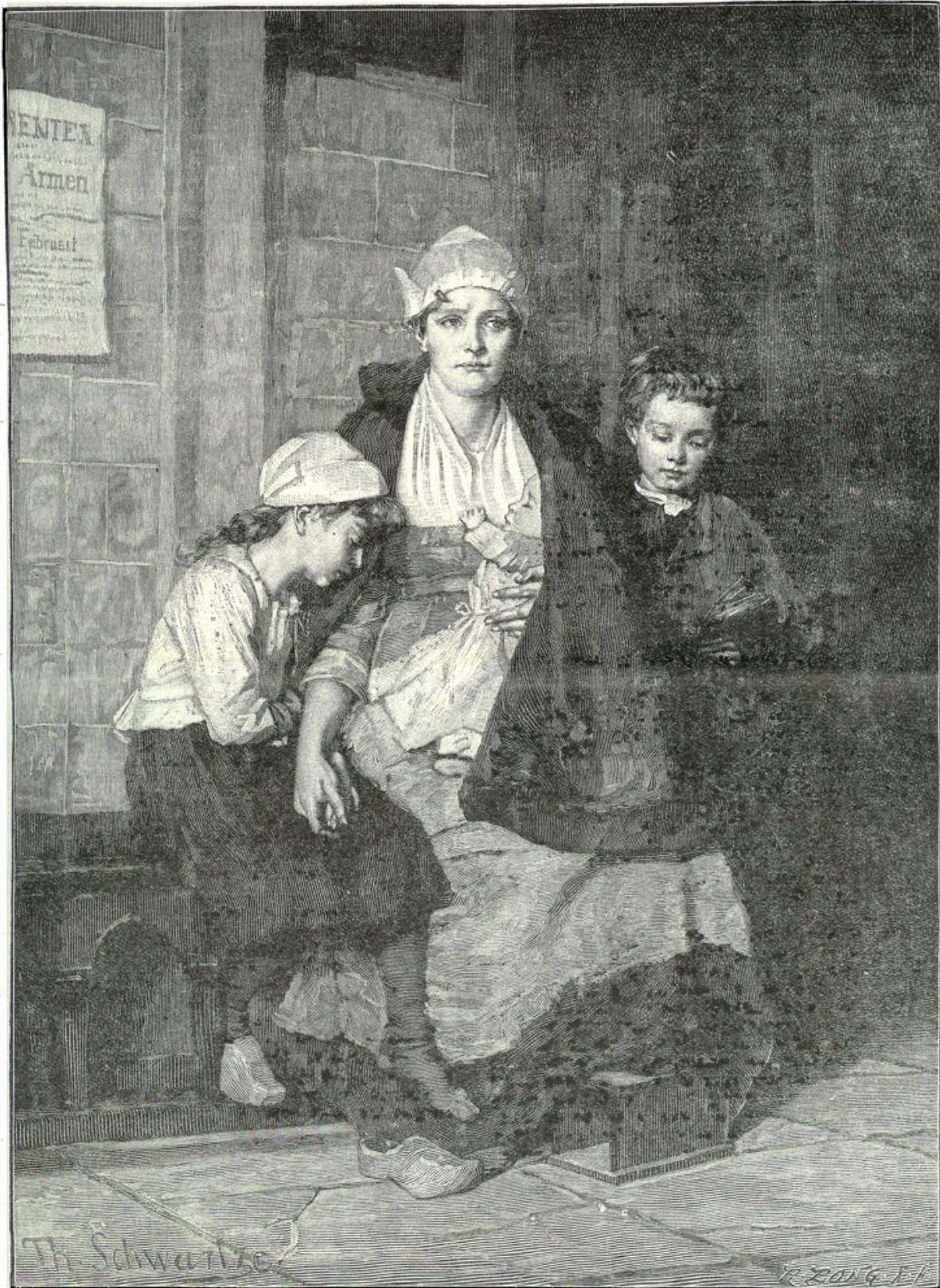
Naar een schilderij van Therese Schwartz.

„Werpt al uw bekommernis op Hem, want Hij zorgt voor u.”