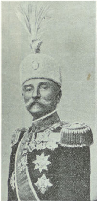
Koning Peter I van Servië.

Weer volgde inwendige strijd, omdat ook Alexander het niet allen naar den zin maakte; hij moest in 1858 aftreden, en de oude Milosj werd teruggeroepen. Weldra werd deze opgevolgd door zijn zoon Milan, en deze moest afstand doen ten