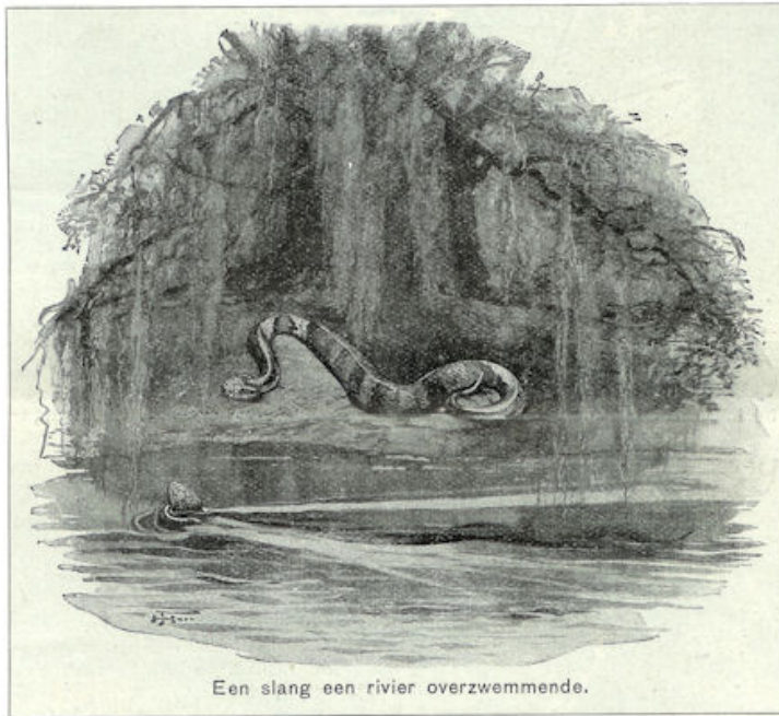
Een slang een rivier overzwemmende.

de voet te zwellen, en het zwellen en de pijn zetten zich tot het bovenlijf voort, zoodat zij telkens neerviel en de kracht verloor om te staan en te gaan. Tot haar geluk was haar moeder bij haar, die haar naar huis bracht, waar terstond naar een chirurgijn gezonden werd. Deze wendde allerlei middelen tot herstel aan, en langzamerhand werd zij ook beter, hoewel haar been tot haar veertigste jaar ziek bleef, en terwijl zich daaraan nu eens blauwe, dan gele vlekken toonden, haar hevige pijn deed lijden, waartegen alle middelen vruchteloos bleken. Op eenmaal hield dit op, doch nu wierp de ziekte zich op de oogen, waaraan zij geruimen tijd zeer veel pijn leed, totdat zij geheel blind werd en in