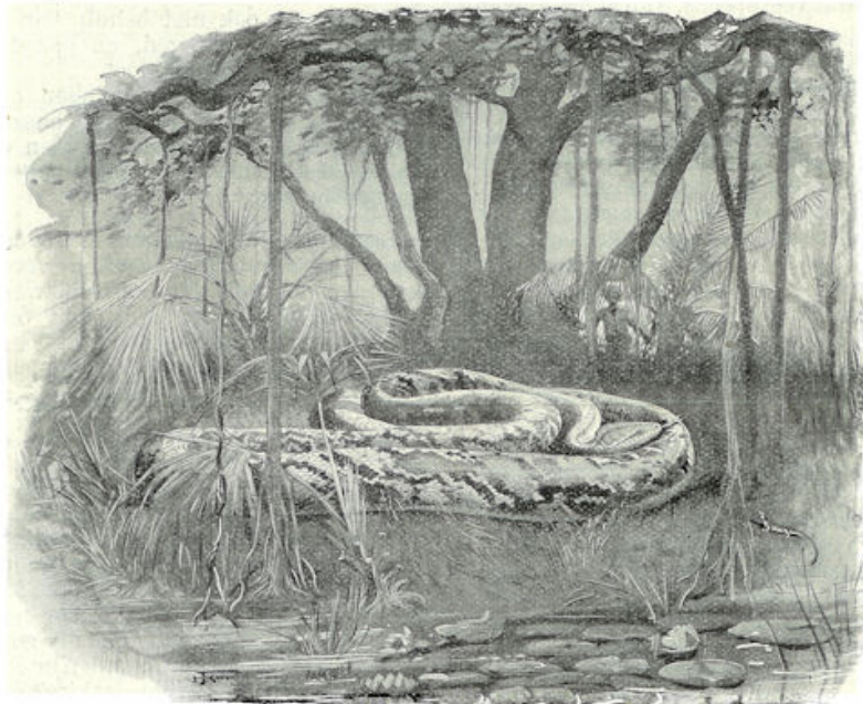
Oelar radia iang boeas di-Amerika.

De meest onschuldige slangensoorten vertoonen zich des