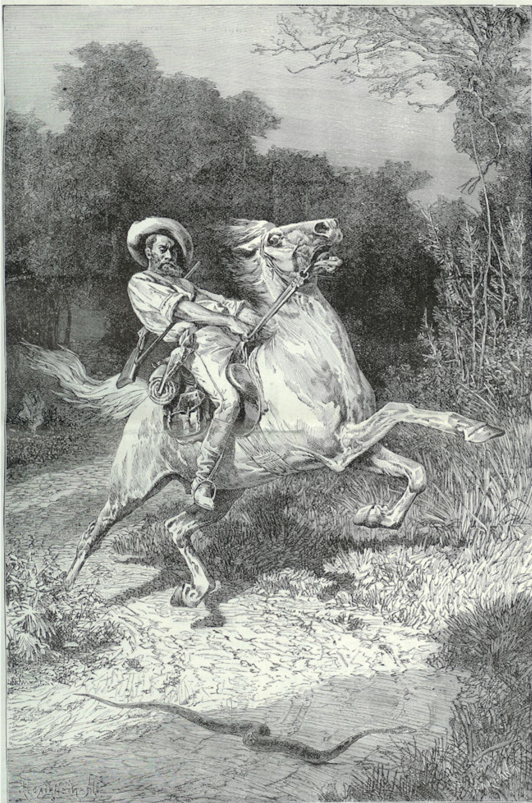
Een slang op den weg. — Een electricische schok doet de knoestige leden van het paard van den Australischen ruiter trillen. Het ros heft de voorpooten omhoog en slaat. Het snuift en blaast. Ver treden de oogen uit hun kassen, en de manen rijzen verstijvend omhoog, terwijl de staart de flanken zweept. Daar moet onraad zijn . . . Een slang op den weg! De gevaarlijke diamant-slang! Nog een oogenblik, en het vergiftige dier zou den kronkelenden staart verheven, het doodelijk venijn paard en ruiter in de aderen hebben gestoken. Doch een sprong op zij redde beide . . .