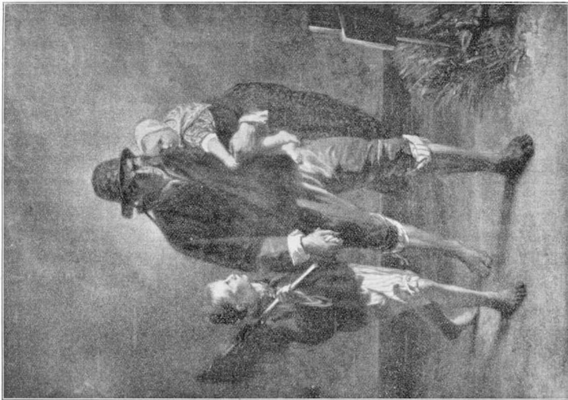
LANGS HET KERKHOFF.