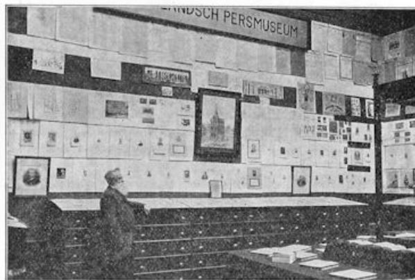
Het Nederlandsch Persmuseum.

Retrospectieve Afdeling. — Ten slotte wat de tentoonstelling zelf betreft — de Retrospectieve Afdeling . Dit is een museum, dat in twee flinke zalen alle oorspronkelijke uitgaven bevat, in Nederland verschenen van de vroegste tijden tot nu toe. 't Behoefte derhalve geen betoog, dat van de geheele tentoonstelling dit gedeelte eigenlijk wel het meest beziens-