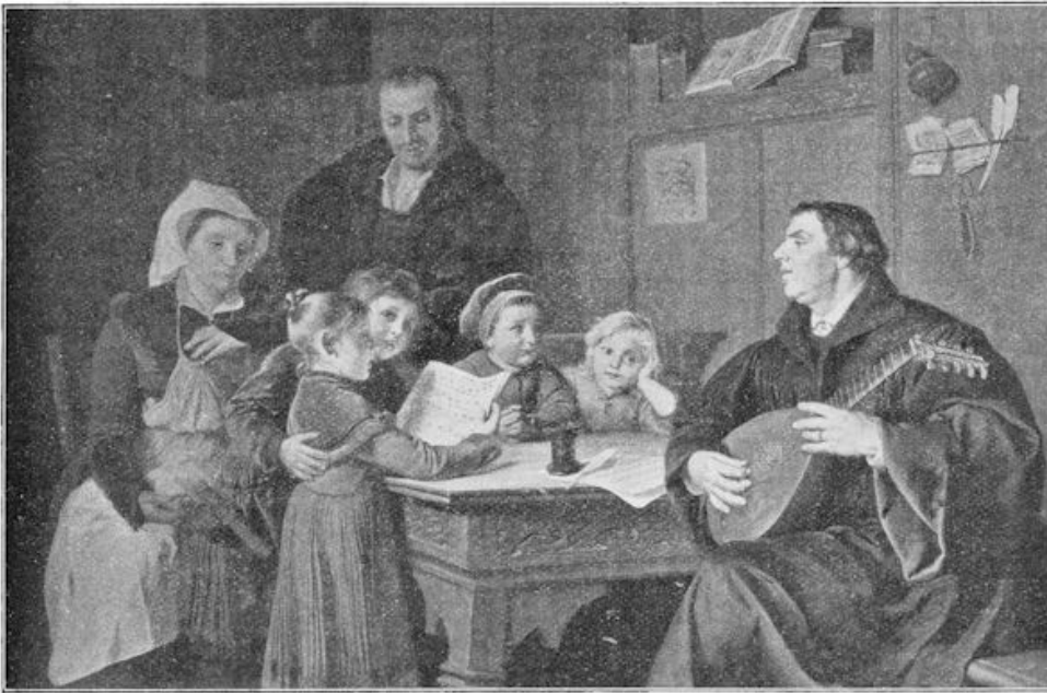
Luther in zijn familiekring.

En nu is het de groote, de kapitale fout van Constantijn den Grooten geweest, dat hij het Christendom gemaakt heeft tot godsdienst van den staat. Dat was een inenten van het Christendom op heidenschen wortel. Voortaan golden alleen Christenen als burgers van het rijk, en wie geen Christen was, werd vervolgd of hoogstens geduld. En dat is de toestand gebleven onder de Christelijke volken tot aan de negentiende eeuw. De Hervorming heeft er niets aan veranderd. In één land één kerk, dat bleef het beginsel, en het was maar de vraag, welke die kerk zou wezen. Vandaar, dat de Hervorming der zestiende eeuw terstond een staatkundige strijd werd, en dat elke vorst en elke natie partij koos voor een bepaalde kerk. Vrijheid van geweten was in die dagen nog geen beginsel, en slechts weinige mannen der zestiende eeuw hebben zoo ver gezien als Willem van Oranje, die in de Pacificatie van Gent Roomschen en Protestanten in één verbond samenbracht. Hij was zijn tijd vooruit, en de Pacificatie heeft nog geen drie jaren stand gehouden. De Unie van Utrecht volgde haar, en gaf alleen rechten aan wie tot de Hervormde kerk behoorde, al werden in ons land der vrijheid Roomschen, Doopsgezinden en anderen van afwijkende meening niet lastig gevallen.