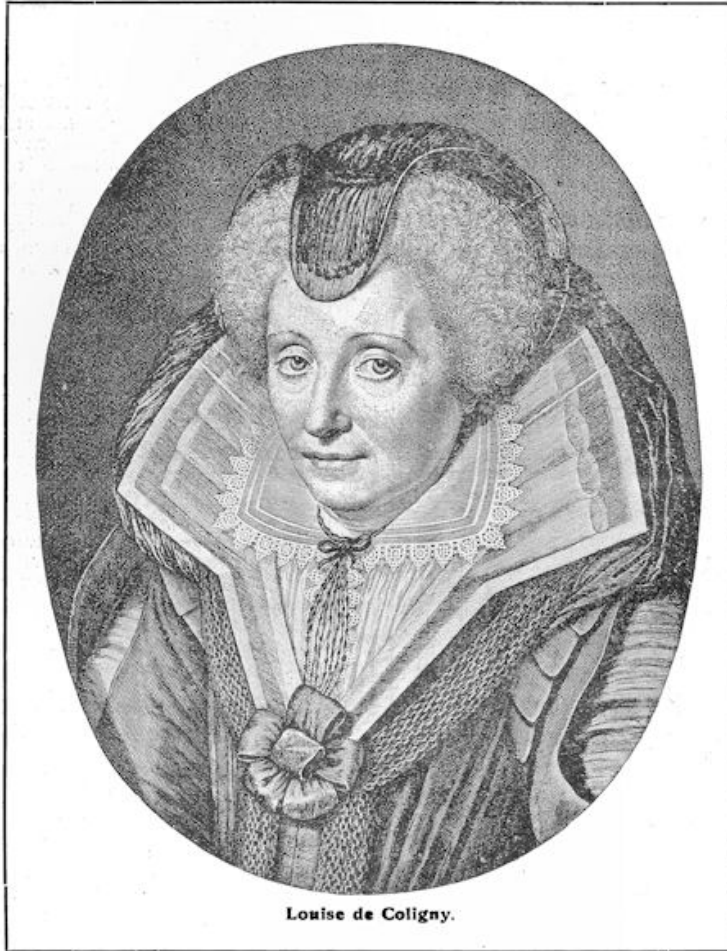
Louise de Coligny.