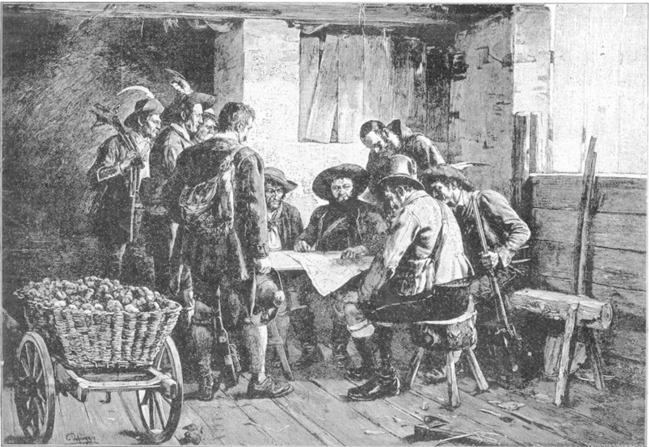
1. — . . . . Toen de jonge, heldhaftige Tyrolerin bericht bracht . . . . 2. — Krijgsraad.