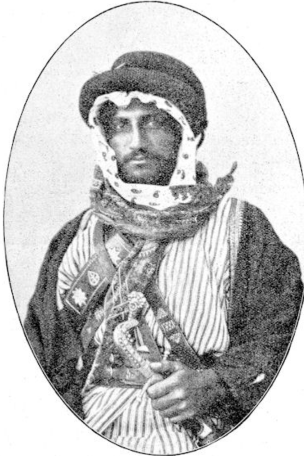
Voorname Bedoëin uit Jeruzalem.

Het aardsche Jeruzalem viel. Waar het doode lichaam was, vergaderden de arenden. De legioenen der Caesars verbrandden het dorre hout, verkochten Jeruzalems kinderen in slavernij, lieten geen steen van den tempel op den anderen en trokken de ploegschaar over den bodem