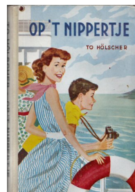
Op 't nippertje 112 blz., [3de druk 1960] Auteur To Hölscher Uitgever G.B. van Goor Zonen, 's-Gravenhage Recensie(s):