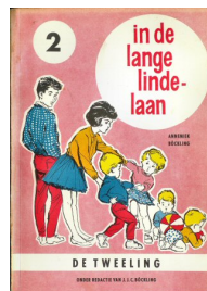
De tweeling : in de lange Lindelaan, deel 2 78 blz., [1ste druk ca. 1964] Auteur Annemiek Böckling Uitgever N.V. drukkerij De Spaarnestad, Haarlem