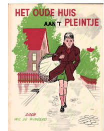
Het oude huis aan 't pleintje 77 blz., [1ste druk 1956] Auteur Wil de Wingerd Uitgever H. Meulenhoff, Amsterdam