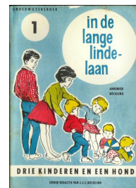
Drie kinderen en een hond : in de lange Lindelaan, deel 1, onderwijzersboek 120 blz., [1ste druk ca. 1964] Auteur Annemiek Böckling Uitgever N.V. drukkerij De Spaarnestad, Haarlem