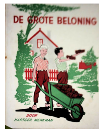
De grote beloning 77 blz., [1ste druk 1956] Auteur H. Menkman Uitgever H. Meulenhoff, Amsterdam Recensie(s):