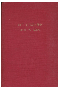
Het geschenk der wijzen 37 blz., [1ste druk 1953] Uitgever Wereldvenster, Baam