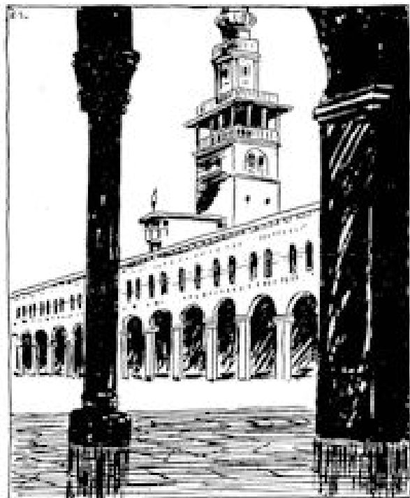
DAMASCUS (VOORHOF GROTE MOSKEE)

de reisgezellen op eigen gelegenheid verder. Te voet, zonder de taal, de zeden en gewoonten te kennen van het land, dat ze doortrokken. Maar ze kwamen er wel. Nazareth, Kana, Kapernaüm, de berg Thabor, werden eerst door hen bezocht. Daarna kwamen