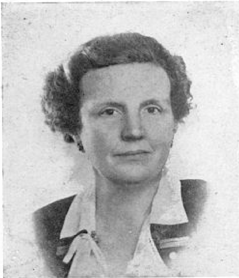
30 April : Verjaardag van H.M. Koningin Juliana