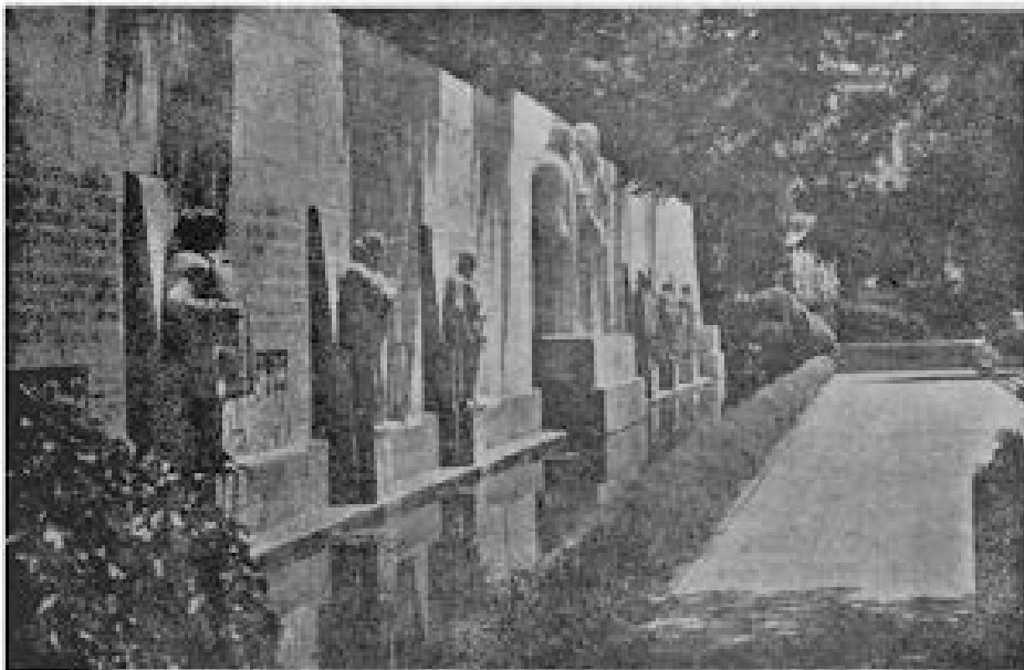
Het Monument der Reformatie, midden in de stad Genève

Er is één jonge negerbediende, die met zijn heer uit West-Indië is meegekomen. Hij heet Anton en deze Anton trekt buitengewoon de aandacht van Zinzendorf. Deze voelt zich niet te hoog om met de eenvoudige negerjongen lange gesprekken te houden. Anton laat al zijn wantrouwen varen en vertelt van het lijden, dat zijn familieleden als plantageslaven dag en nacht te verduren hebben. Door deze verhalen werpt Zinzendorf