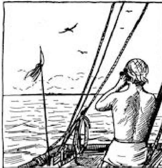
„LAND IN ZICHT“

het kantoor van het Zeister Zendingsgenootschap, waar een deel van de grote wereldzending is ondergebracht, n.l. de zending in Suriname en de West. Want de twee grote wereldoorlogen hebben het éne grote werk in verschillende delen uiteen doen vallen. Het deel, dat Nederland toeviel, is onze West. Er is een groot werk geschied, daar in Suriname. De Creoolse kerk is geen zendingkerk meer, maar een eigen landskerk met eigen predikanten, onderwijzers en zendingelingen. Want altijd nog zijn er in die uitgestrekte gebieden Bosnegers en Indianen, die nooit van de Here Jezus hebben gehoord en die Hem toch zo nodig hebben in hun strijd met de duistere geesten. Behalve het werk van de prediking is daar ook nog het werk van de medische zending, die eigenlijk op zichzelf ook een prediking is van naastenliefde om Jezus' wil. Daar is de leprozerie „Bethesda“, waar de vele