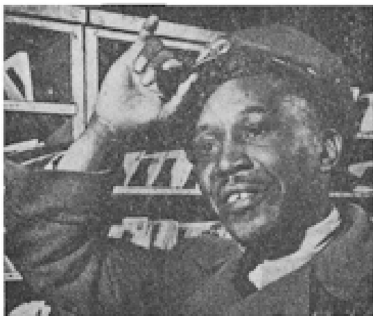
Deze brievenbesteller heeft een rijksbetrekking, die hem bestaanszekerheid verschaft, en de kans biedt om vooruit te komen.