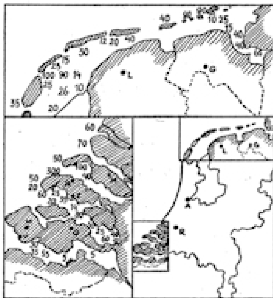
dekking, dat op verschillende zandbanken telkens hetzelfde aantal stip-

Toch is de afname veel minder snel, dan men zou verwachten. Dit komt doordat de zeehondenjacht in de Duitse Waddenzee sterk is be-