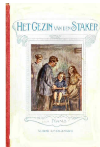
Het gezin van den staker 109 blz., [1ste druk 1922] Ill. O. Geerling Uitgever G.F. Callenbach, Nijkerk Open boekje op Delpher